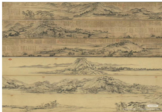
图 3-2 《富春山居图》

道家与儒家在色彩取向上的“素”“文”差异，在“和合”精神中实现契合。正如《易经》“阴阳”辩证思维，两极相生相克构成动态平衡系统，这一统一在画史中体现为“墨”与“彩”的融合。浅绛山水以水墨勾勒为骨，少量敷施淡色，实现素雅与文润的平衡，元代黄公望《富春山居图》便是典范。明代董其昌“南北宗论”虽有片面性，但推崇水墨“渲淡”却不否定青绿“着色”的调和思想，彰显中国艺术兼收并蓄的“和合”智慧。“墨分五彩”与“随类赋彩”如阴阳两极，在矛盾中依存转化，造就中国画色彩体系的动态平衡与持久生命力。