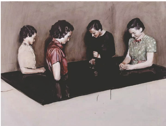
图2 图像时代下的当代架上绘画创作现状