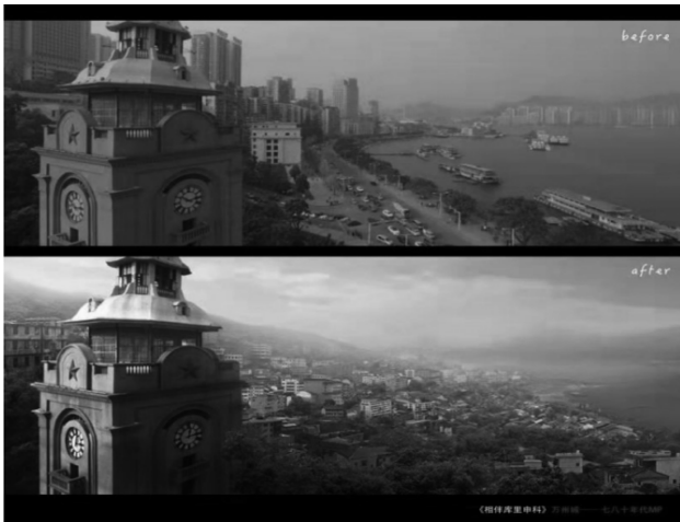
图1 数字绘景画面再创作

传统油画依赖于颜料、画布、画笔等实体工具,艺术家通过手工操作完成作品。而现在,数字化工具的引入为艺术家提供了更多的选择和便利。平板电脑、数位板、图形处理软件等工具让艺术家可以在虚拟空间中进行创作,甚至模拟出油画的质感与效果。这些工具不仅简化了创作流程,还为艺术家提供了在试错和修改方面的无限可能。艺术家不再需要担心颜料调和的时间成本或画布上无法挽回的失误,数字化工具让创作变得更加灵活和自由。此外,数字工具还为艺术家提供了更丰富的色彩选择和笔触效果,甚至可以通过不同的滤镜和光影效果,模拟出传统绘画中难以实现的视觉体验。数字绘景画面再创作如图1所示。