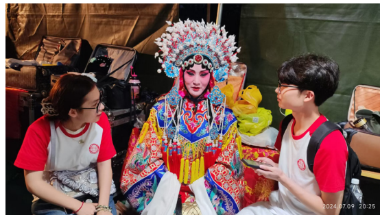
图2 秦腔演出后台实地采访图

团队与岐山县当地秦腔传承人进行交流,通过对他们的采访和当地对观众的调研(见图2),使团队对传统秦腔剧目有更深层次和全面的解读,完成新式秦腔剧本的改编。