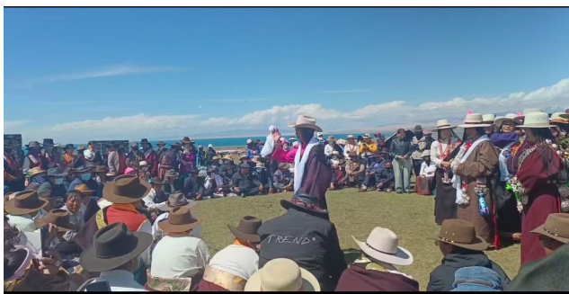
安多拉伊对唱现场

在藏族社区中，年长者通过社区活动和节日庆典将拉伊情歌的传统传授给年轻人。一些有才华的拉伊情歌演唱者会收徒授艺，通过一对一教学传承演唱技巧与创作经验。安多拉伊不仅是一种艺术表达形式，更是藏族文化的载体。它是藏族人民表达民族情感和文化认同的重要方式。通过演唱情歌，人们加深了对本民族文化的认同感。拉伊的演唱通常伴随社区活动和节日庆典，是人们进行社会互动与情感交流的重要场合。