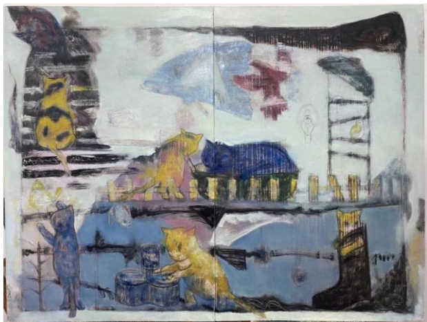
图 3.1 本人《猫儿》

构图是绘画创作中的另一个关键因素，它决定了画面的视觉流动和重点。在以猫为主题的作品创作中，我通过构图来引导观众的情感体验。例如，将猫置于画面的中心可以突出其重要性，而将其放在边缘则可能营造出一种旁观者的感觉。猫的形象与其他绘画元素的“开敞式铺陈”，可以增加画面的故事性和情感深度。我将猫爬架提取为粗细不一的线条，穿插与画面其中，像画卷一般完全展示在观者面前，长短横竖不一的线条与猫咪的色彩团块成为辅助构图有力的支撑，线条的轻重缓急剥离与吞噬处理丰富了画面的表达。