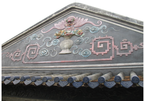
图3 番禺小谷围祠堂灰塑

灰塑工艺。灰塑是岭南尤其是广州传统的建筑装饰工艺，据史料记载，早在康僧信宗和四年（公元884年），灰塑工艺就已经存在，到明清两代更得到广泛应用，尤以祠堂、庙庵、寺观，豪门大宅用之最多，灰塑又称灰批，是指以石灰为主要做成的浮雕作品。用灰、水泥、米糠三种混合，先弄一个模子，然后做成成品再上色，或用批刀直接雕贴于墙上制成花卉、鸟兽或人物构图，作建筑物正脊或檐下装饰，又可作内部装饰，对建筑有着保护和装饰作用，灰塑分浅浮雕、高浮雕和立体圆雕，广州灰塑的特点鲜明，色彩艳丽，立体感强，富有动感，具有岭南的庄重、精致、内秀的特色。以大红大绿为主，石灰材料尤其适合番禺湿热气候一耐酸、耐碱、耐温，具有传统民间美术特色，迎合本地民众的审美要求，折射出本地人民的民间信仰习惯。题材多以山水、人物、动物、花鸟，如狮子、金鱼海藻、鹤鹿等寓意吉祥的动物花鸟图案，并配以树石栏杆，造型生动，立体感强，色彩华丽，历经百年仍鲜艳夺目，其有显著岭南地域特色。