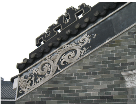
图4 番禺小谷围祠堂灰塑