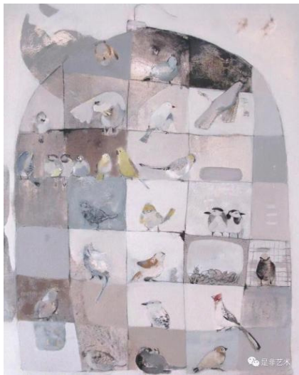
图 2.1 叶慧玲《笨鸟儿系列之一》

“笨鸟儿”系列作品不仅仅是对鸟类形象的再现,更深层地,它们是对人生境遇的比喻。在这些作品中,鸟儿的形象象征着人类在面对生活挑战时的无助与坚韧,反映了人们在现代社会中的迷茫与探索。叶慧玲通过对鸟儿的描绘,传达了一种坚持与希望的信息,鼓励人们在困境中寻找自我,勇敢地展翅飞翔。在处理画面的方式上,她的画一方面利用光影的微妙变化以及肌理和笔触构成空间感;另一方面,这些光源和消失点的多重性又构成一种多视角空间,激发出与现实空间相悖的超现实空间体验。