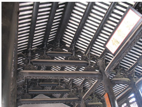
图1 沙湾留耕堂の木结构

木结构是中国古建筑艺术的精华和代表，番禺古祠堂大多都采用了木结构建筑。并且主要采用了抬梁式构架，建筑的主体骨架就是通过石柱和木结构构件、梁、柱、斗拱细分构件组合而成。木结构语言是古祠堂建筑的骨架灵魂，它通过复杂的组合，形成具有很高的艺术特色，一排排的石柱、木柱，斗拱，形成错综复杂，古朴大方的艺术语言，在木构件上配以各种装饰雕花，使建筑造型更富变化。梁、枋、斗拱各种构件，通过雕饰，艺术处理华丽、精致，产生自然优美的弧线，复杂斗拱使木结构语言更为丰富，不仅有实用性，同时有很强的视觉效果，构架雄伟壮丽，复杂的斗拱使构架平衡，同时也起到很好的装饰作用。