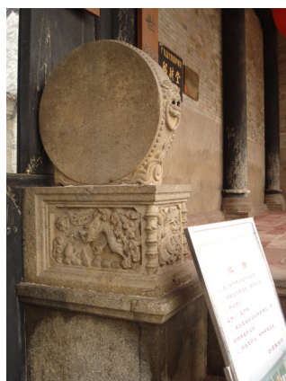
图 15 祠堂石雕的吉祥图案