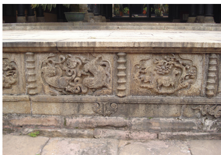
图 14 祠堂石雕的吉祥图案

在番禺祠堂之中,有很多的吉祥图案在其中装饰着建筑,在不同的团组合之中,也充分展现了吉祥如意的美好寓意。吉祥图案是将吉祥语和图案完美结合艺术形式,它在我国民间流行尤为广泛,是我国劳动人民智慧结晶,反映我国纯美的民风民俗。