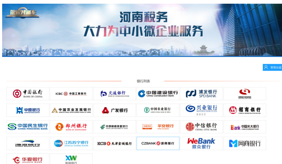
图 1 河南税务银税智通车平台

以中国建设银行云税贷为例，年化利率为 3.75%，假如供应商一年纳税 20 万，根据系统测算企业的纳税信用情况，贷款额度一般为纳税金额的 5-8 倍。按照 1: 7 的贷款比例，可以贷得 140 万，贷款年限为一年，利息为 140 \times 3.75\% = 5.25 万。而供应商通过其他渠道的融资年化利率一般在 8%-12%，且需要有抵押，贷款年限为一年，利息为 140 \times 10\% = 14 万，通过云税贷可以为供应商减少 14 - 5.25 = 8.75 万，利息降低 60% 以上，极大降低供应商的融资成本。