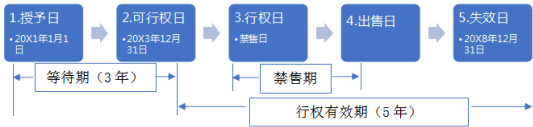
图1 股票期权行权过程

工具数量的最佳估计为基础，按照权益工具授予日的公允价值，将当期取得的服务计入相关成本或费用和资本公积。