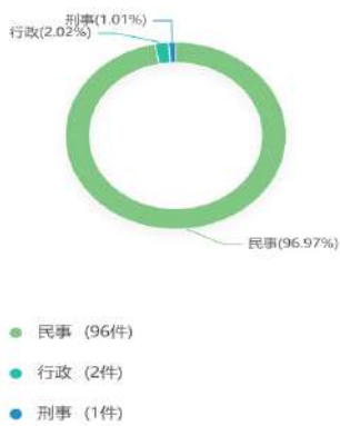
图 1 案件数据