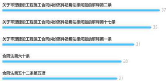
图 2 适用的法条数据

对于案件中的建筑施工企业内部承包合同效力的认定，其中 77.81% 都被认定为无效合同，其核心原因都是法院认定为构成承包人非法转包、违法分包建设工程或者没有资质的实际施工人借用有资质的建筑施工企业名义与他人签订建设工程施工合同。通过上述数据可以显示出，虽然签订内部承包合同是十分常见的，但是一旦诉讼发生，内部承包合同被法院认定无效的概率是十分大的，如图 3 所示。