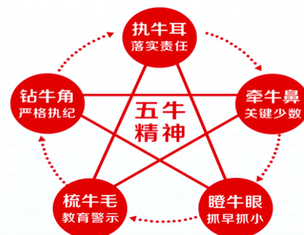
图2 党风廉政建设“五牛”精神