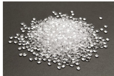
图2 聚丙烯绝缘材料

聚丙烯绝缘材料具有较低的介电损耗系数和较高的击穿场强（图2），在传输过程中损耗较小，效率较高，承受较高的工作电压。与传统材料相比，它对电树生长的抑制作用更强，延缓绝缘老化。某110 kV线路投入运行后，输电能力提高10%，运行平稳。