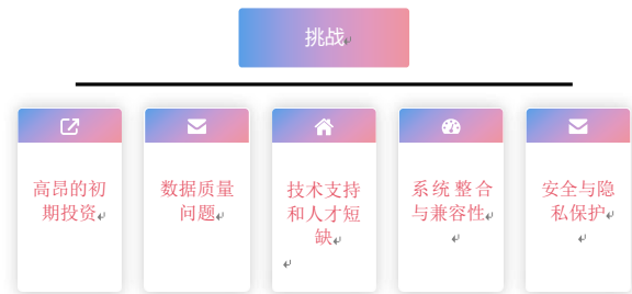
图2 智能化技术的挑战