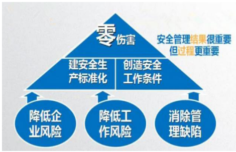
图1 安全生产标准化建设理念