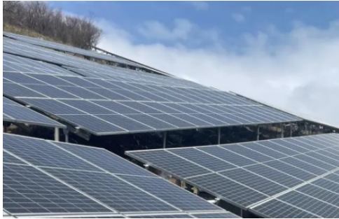
图1 光伏电站建造实景

备的倾斜和不稳定。根据光照条件和地形特征，我们还需考虑光伏电站的布置方式，确保在最大程度上利用自然光照，减少阴影遮挡，提高发电效率。光伏电站建造实景详细图1所示。