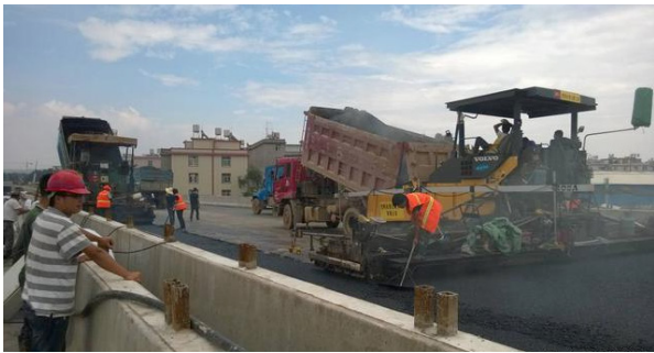
图1 沥青混合料摊铺施工图

风力如果过大的话会加快混合料散热速度，引起温度下降过快，对摊铺和碾压的效果产生影响，大风还会把混合料吹散，造成材料损耗以及环境污染。为应对大风天气，施工人员需要合理安排施工时间，尽量避开大风天气时段，在摊铺过程中，要采取防风措施，比如在摊铺机周围设置挡风装置，以此减少风对混合料的影响。同时，要加快摊铺和碾压的速度，尽快完成施工，缩短混合料暴露在风中的时间。图1为沥青混合料摊铺施工现场。