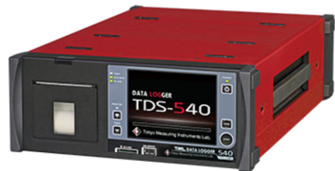
图 2 TDS-540 全能型静态数据采集仪

在桥门式起重机应力测试过程中，电阻式应力测试法的应用非常广泛。这是一种对应变片电阻变化进行测量，再通过计算得出应力，然后以此对起重机使用安全性进行评估的方法。与其他方法相比，这种测试方法的应用优势是便捷性强、对被测试构件应力的影响轻微，可以保证应力测试结果的准确性与有效性。但是，这种测试方法的应用劣势也比较明显，即测量方式过于单一，不能保证输出信号的稳定性 [4] 。并且，在测试过程中，如果应变片出现浸水、锈蚀等问题，也会对应力测试结果的准确性产生较大影响。电阻应变片由四部分构成：第一基底、第二覆盖层、第三引线、第四敏感栅。当电阻应变片受到外力之后，电子应变片会发生形变。在粘结剂与基底的传递下，电阻应变片的形变也会对敏感栅产生影响，改变电阻应变片中的电阻。通过电阻应变仪，可以将应变片中的阻值变化测量出来并以正比于应变值的电信号输出，再通过计算即可得出桥门式起重机金属构件的应力值。图 2 为 TDS-540 全能型静态数据采集仪。