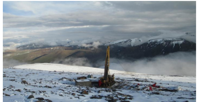
图 2-2 钻探施工图

然而，在实际施工过程中，仍面临诸多技术难点。例如，在冻结的松散冻土中及基岩上部松散破碎且裂隙发育地段，容易发生坍塌掉块和漏失现象。此外，由于永冻层不断被融解，导致卡钻、埋钻事故频发，且提钻后孔内迅速结冰，钻探的扫孔时间大多超过了正常钻进时间，容易形成复杂的孔内事故甚至钻孔报废。