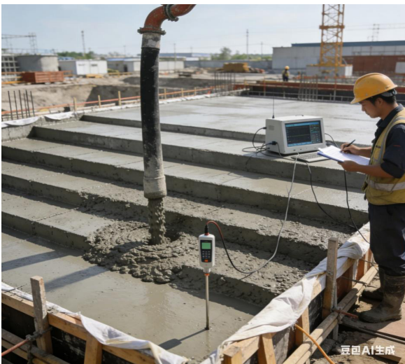
图2 大体积混凝土分层分段浇筑工艺示意图

随着施工技术的提升，大体积混凝土的浇筑工艺将不断改进。分层分段浇筑，是指将大体积混凝土分层分段进行浇筑的方法，例如跳仓法、分层浇筑法、后浇带法等 [2] 。但是，由于温度控制的复杂性，温度裂缝的产生往往有多种原因：①对混凝土的养护，即对温度的控制；②对环境的监测，即环境温度对混凝土的影响；③对配合比的控制；④对浇筑顺序和养护的控制：对混凝土的养护，即对温度和湿度的控制。