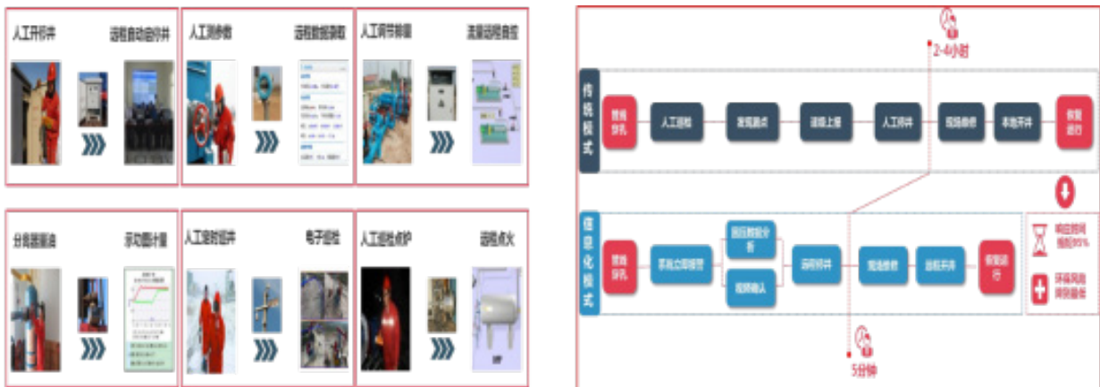
图 2 数据采集、远程控制示意图

油气生产物联网平台（A11）。实现油水井、计配站和联合站生产参数的实时采集、工况报警、在线计量、远程启停等功能，可减少巡检频次、实现无人值守。