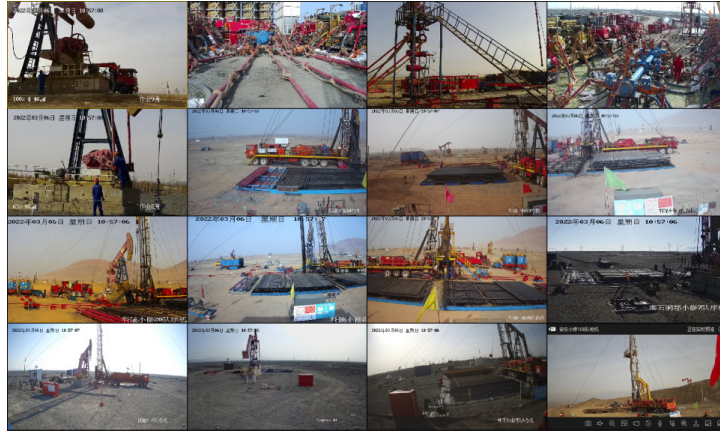
图 3 视频监控画面展示图

双重预防信息平台。按照“功能独立、大小适中、易于管理”的原则，组织对 3 个重大危险源的生产工艺装置、储存设施开展安全风险辨识对象风险评价活动，划分风险分析单元 26 个，录入风险分级管控清单及隐患排查治理清单 481 项，实现重大危险源在线检测、实时预警、快速处置、隐患排查治理“四全”管理。