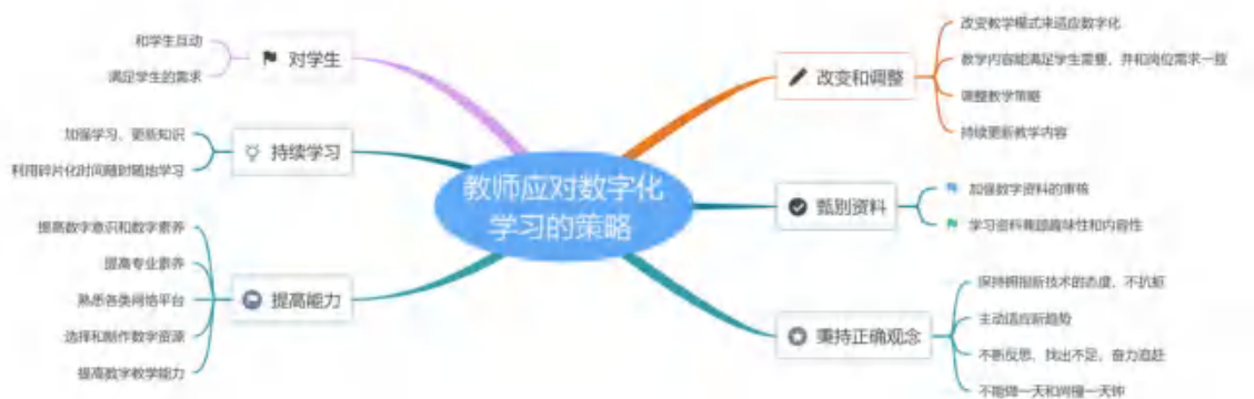
图 2 教师应对数字化学习的策略