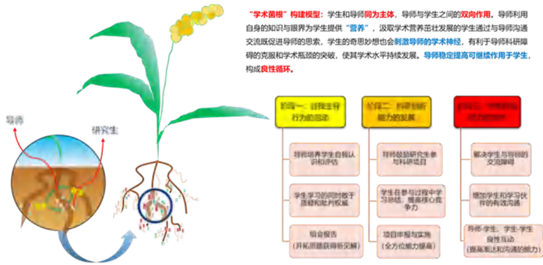
图1 “学术菌根”概念模型