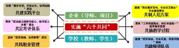
图2 “双元六共”新型学徒制校企协同育人模式

“双元六共”新型学徒制校企协同育人模式如图2所示。该模式依托企业与学校的深度合作,推行“企校双制、工学一体”的培养机制。