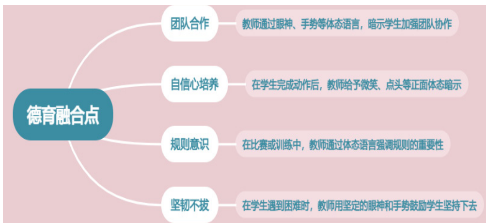
图2：体态心理暗示教育法与德育的融合点图

体育课程教学实践主要内容是以职业院校学生身体素质专项培训与练习等项目内容为主，同时也是一门实践能力相对很强的体育项目，体育项目的训练本身就不复杂且具有较高的民族文化思想内涵，学生群体则往往可以通过体育课程的学习来磨炼个人精神意志，在各种体育单项运动比赛与实战练习中能充分通过个体与团队同伴们的精彩竞技配合训练来获得身心愉悦的精神享受，这无疑是体育教学区别于其他体育或者传统竞技训练项目的显著特征 [6] 。