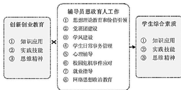
图2 大学生就业创业教育融入辅导员思政育人工作的模式

师培训计划,既要更新教师的教育理念,同时促进教育方法的创新。其中,常见的培训方法有集中培训、观摩优秀案例、交流共享等方式,同时还需要定期组织开展专家讲座活动,引导教师走进企业顶岗实践,促进教师创新素养、实践能力、专业基础的全面提升。针对融合教育中出现的恩替,高校要定期组织教师深入探究、共同研讨,以便优化整改教育方案,引进优秀教育经验,助力教师成长,促进整体教师队伍质量的去年提升。高校要强化教师自我学习能力,如自觉参与创业项目,为学生提供专业性指导,保障教师专业能力、自主学习能力的全面提升。要对教师进行全面的專業基础、教学能力、创新实践能力方面的考核力度,以此为依据调整培训方式。还要注重优化教师结构,创新人才引进方式,聘请行业精英、思政教育专家等到校兼职教学,同时把辅导员纳入到教师队伍中,发挥其积极作用,其中,大学生就业创业教育融入辅导员思政育人工作的模式如图2所示。