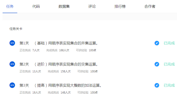
图 2 头歌平台实验关卡

目前数据结构实验课只有 16 课时，同时考虑到我院学生的实际情况，将实验内容分为 8 个实验，分别是顺序表、单链表、栈、队列、二叉树遍历、二叉树遍历的应用、基于邻接矩阵的图遍历及应用、基于邻接表的图遍历及应用，下面简称为实验 1 至实验 8。