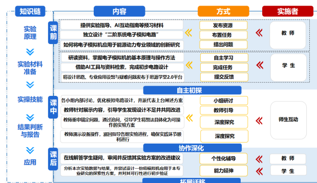
图 2 “典型环节及二阶系统电子模拟实验”教学模式设计

“问题导向、数字赋能、迭代优化”的闭环探究教学模式：为突破传统实验授课的局限，充分挖掘验证性与设计性在培养学生实践能力、设计思维与专业根基方面的潜力，对验证性与设计性实验进行教学创新，具体包括：发布开放性预习任务、学生进行预习及分组研究实验预案、开展启发式课堂讲授以及实施综合型考核评价等环节。该模式以源于专业领域的工程问题为驱动，依托数字化工具全面赋能教学全过程，通过“课前初探-课中深化-课后迁移”的迭代循环，推动学生工程思维与创新能力的阶梯式发展。以“典型环节及二阶系统电子模拟实验”为例，通过实施上述创新改革（具体措施如图 2 所示），原有的验证性实验得以转化为拓展性综合实验，进一步助力学生构建自主学习和创新实践能力，提升其发现问题、分析问题与解决问题的综合素养，从而实现了依托基础实验培育卓越工程人才的教学目标。