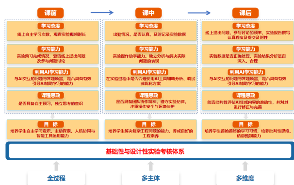
图3 基础性与设计性实验考核体系