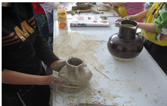
图6 泥塑艺术实践之瓦罐制作

2017年9月,中国黑龙江省哈尔滨市靖宇小学泥塑艺术实践工作坊开展为期两天的泥塑体验活动,图6为学生在进行瓦罐创作。