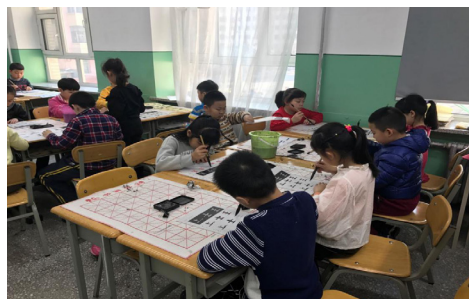
图2 书法体验活动

2018年1月，中国黑龙江省哈尔滨市南马路小学举办书法艺术实践工作坊体验活动，如图2所示。