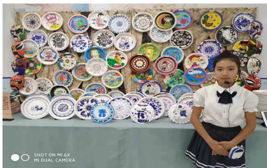
图5 纸盘画艺术实践展示会

2017年6月,中国黑龙江省哈尔滨市大同小学纸盘画艺术实践工作坊活动作品展示会,图5为展示会作品。