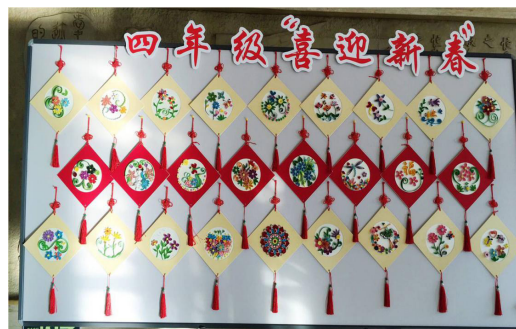
图4 衍纸艺术实践活动学生作品展示

2018年1月，中国黑龙江省哈尔滨市大同小学开展衍纸艺术实践工作坊课外实践活动，图4为学生作品展示。