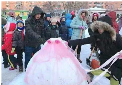
图8 冰雪艺术实践活动

2017年12月,中国黑龙江省哈尔滨市南直小学冰雪艺术实践工作坊开展活动,如图8所示。