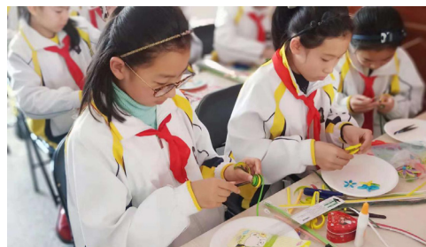
图3 衍纸艺术实践活动

2017年10月，中国黑龙江省哈尔滨市大同小学开展衍纸艺术实践工作坊课外实践活动，图3为活动剪影。