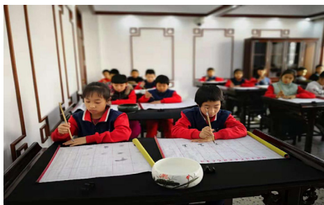
图1 书法教学活动

书法是中国传统文化的重要组成部分，是中国特有的艺术形式。书法使人怡情气爽、陶冶人的情操、修身养性，正所谓“静以修身、俭以养德”。基于此，黑龙江各中小学校在国家、省、市的号召下均设立了“书法艺术实践工作坊”。法艺术实践工作坊定期开展书法教学活动，通过让学生亲自观察教师的操作、亲自动手书写，来培养学生对于书法这一中华传统文化的认识。通过艺术实践工作坊的方式进行教学，改变了原本的鉴赏类的书本式教学模式，与传统模式相比，给予学生更多发挥的空间，有助于培养学生的自主意识。2017年9月，中国黑龙江省哈尔滨市冰雪文化学校书法艺术实践工作坊开展书法教学活动，如图1所示。