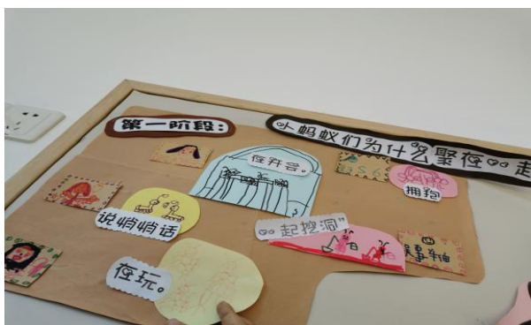
图1 幼儿开大会讨论

孩子们对蚂蚁工坊里的小蚂蚁们有着或这或那的猜测，但大多数的意见都是围绕着蚂蚁要造个家的话题。