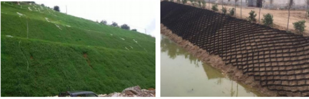
图1左：植草护坡；右：土工材料复合种植基护坡