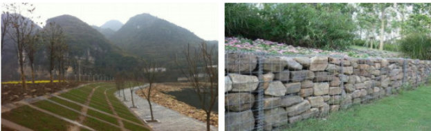
图2左：生态混凝土护坡；右：生态网箱护坡

生态网箱护坡（又称石笼网生态护坡或格宾网植生护坡）是一种将金属网箱结构与植被种植相结合的新型护坡技术。它继承传统石笼护坡的抗冲刷、抗变形优势，同时通过网箱内填石缝隙覆土种植或顶部覆土绿化，实现工程防护与生态修复的双重目标，尤其适用于河道治理、水利工程及侵蚀严重的土石边坡。如图2右所示。