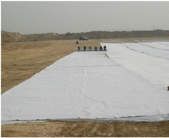
复合土工膜施工现场

地嵌入基底,形成有效的止水结构。压埋之前一定要清除沟内的碎石杂物,防止膜片在应力集中的时候出现刺破或者撕裂的问题。整个压埋过程注重施工步调的配合,也就是焊接、检测、压埋要形成闭环,防止焊缝暴露或者二次受损。