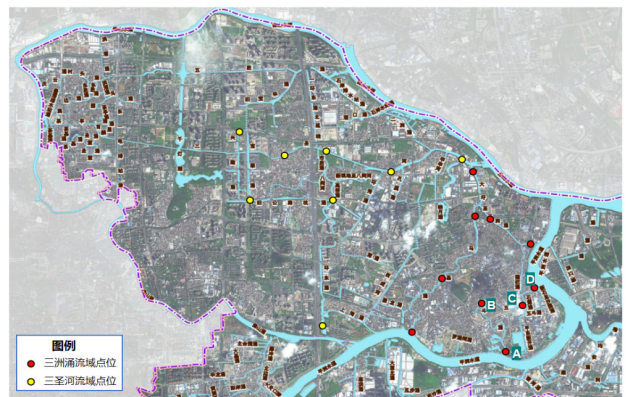
图 1.3 平东片区布点分布图