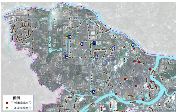
图 1.1 一环东涌 - 三圣河片区布点分布图