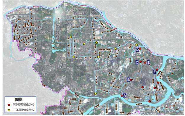
图 2 大墟至三洲涌 - 马基涌片区布点分布图