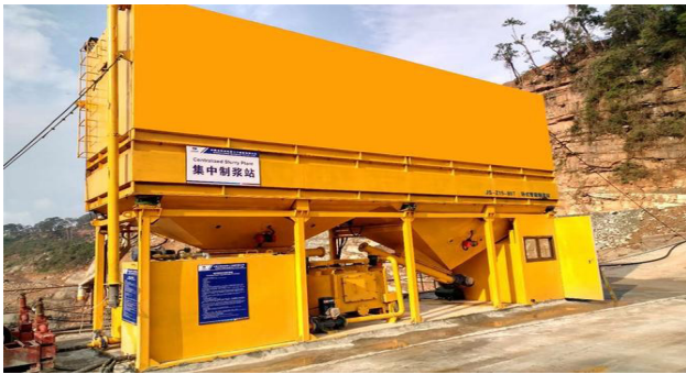
图 1-1 集中制浆站

行业发展的必然趋势。本文旨在结合山区高陡边坡的施工特点，浅谈如何科学合理的设计与应用集中制浆站，以服务于基坑底板与坝肩的大范围灌浆施工。