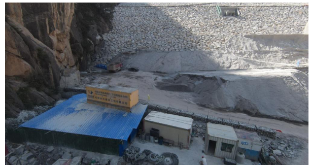
图 3-1 集中制浆站选址

(4) 满足必要的空间要求：所需场地应能容纳制浆机房、散装水泥灰罐、水箱、沉淀池、值班室等设施，并留有必要的设备安装、操作和物流周转空间。