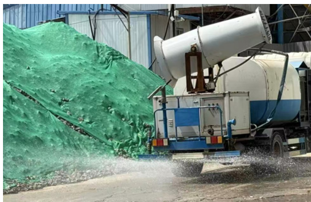
图2 洒水降尘现场图

采取洒水降尘措施,抑制扬尘产生;土方运输宜使用密闭式车辆,减少环境污染。应为施工人员配备防尘口罩、护目镜等个人防护装备,保障职业健康。遇暴雨、大风等极端天气,应立即停止露天作业,并对脚手架、工棚等临时设施进行加固,防止发生倒塌事故。图2为洒水降尘施工现场。