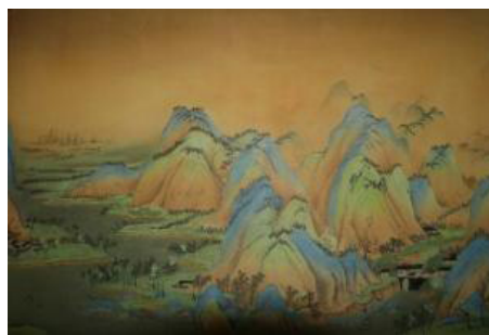
图1 北宋 王希孟《千里江山图》（局部）

北宋时期的画家偏好这种构图方式，他们将画面扩展至极致，创造出宏观的自然景观，呈现大自然的广阔与包容。这种方式不仅展示自然的壮丽，也体现了画家对宇宙、自然的敬畏和向往。如王希孟的《千里江山图》（图1）。