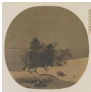
图2 南宋 夏圭《雪溪放牧图》

南宋时期，画家们更倾向于这种集中与精致的构图，通过特定自然细节的精细刻画，展现大自然的精神内核。这种“小中见大”的方式，符合中国古代“留白”美学，通过留白激发观者的想象力，营造深层次的意境。如夏圭的《雪溪放牧图》（图2）。