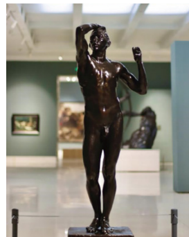
图6(法)罗丹，《青铜时代》，1877年，高170cm宽60cm厚60cm，青铜复制品，由罗丹博物馆提供，全山石艺术中心藏（原作藏于罗丹博物馆）

脊曲线、舒展的肌肉纹理，暗合古希腊雕塑的“动态平衡”法则。这种“科学真实”与“古典理想”的并置，表明库尔贝式现实主义并非完全摒弃形式美，而是在经验观察与美学传统间建立新平衡。布德尔《弓箭手赫拉克勒斯》（图7）则进一步拓展这种张力：以现代运动员体魄重构神话英雄，青铜表面的粗犷肌理与古典原型形成材质对话，现实主义由此超越题材限制，成为“现实质感”与“象征维度”交织的美学范式 [4] 。