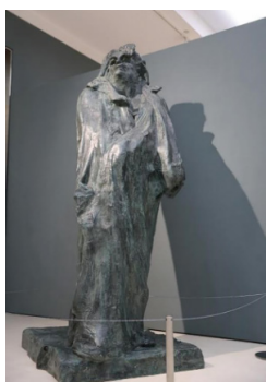
图8(法)罗丹,《巴尔扎克》,1898年,高270cm宽120.5cm厚128cm,青铜复制品,由罗丹博物馆提供,全山石艺术中心(原作藏于罗丹博物馆)

罗丹《巴尔扎克》（图8）的创作理念，成为中西美学对话的桥梁，与中国写意美学形成深层呼应。其雕塑以粗犷肌理与流动衣褶营造“文人夜思”意境，其“离形得似”之法暗合梁楷减笔人物精神，青铜斑驳质感亦通石涛“虚实相生”之观，彰显艺术精神的跨文化共通性。再如弗拉曼克的《农舍》（图9），乌云低垂，明暗对比强烈，颇有“乌云压城城欲摧”之势，遒劲的枝干如黑色的闪电，狂放的书写性笔触像中国书法中的狂草一般，接近中国的写意精神，传达出暴风雨来临时的氛围。