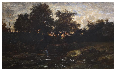
图2 (法) 泰奥多尔·卢梭《康塔尔的捕蛙人》，1846年，布面油画，60.5cm x 98cm，全山石艺术中心藏

在视觉革命进程中，杜比尼的“水上画室”实践具有特殊的方法论价值。其晚年重要作品《制桶者》（图3）以黄昏时分的劳作场景，将农民日常升华为田园史诗。1857年启用的画船“小盒子”（Botin），通过移动观察构建动态视觉坐标系，这与宋代文人书画船的“搜妙创真”形成跨时空理念共振。值得注意的是，中国唐代张璪“外师造化，中得心源” ② 的命题，强调自然观察与心灵体悟的辩证统一，而巴比松画家则通过外光写生将“光色一笔触”作为独立表意媒介。两种传统在“自然作为认知起点”层面形成比较视域，却在技术路径上呈现根本差异：前者侧重“以形写神”的意象提炼，后者追求“光学真实”的物质性再现 [2] 。