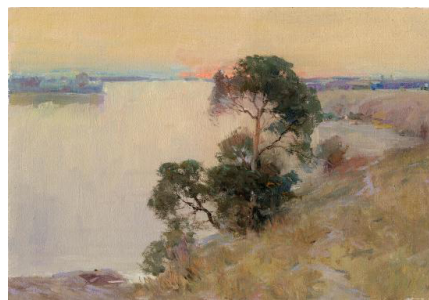
图10 杨鸣山,《宁静的余晖》,1980年,18.5cm×27cm,布面油画,杨鸣山家属捐赠 全山石艺术中心藏