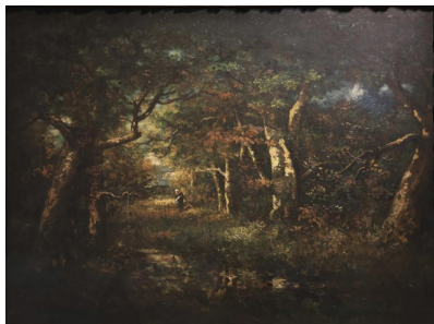
图4(法)纳西斯·迪亚兹·德·拉·佩纳，《灌木丛下的农民》，1856年，布面油画，110cm x 150cm，全山石艺术中心藏

创作，如迪亚兹《灌木丛下的农民》（图4）突破学院派“完成度”标准，以未完成的笔触肌理宣告绘画性独立。迪亚兹以冷暖色对比解构固有色，预示印象派光色革命；杜比尼的“分割笔触”通过色阶微差模拟水纹流动，已具莫奈“色彩分割法”雏形；杜普雷的厚涂技法更以颜料堆砌形成“地质触觉”。这种对媒介物质性的强调，与安格爾新古典主义的光滑笔触形成尖锐对抗。艺术史研究表明，巴比松画家凭借画面的“未完成特质”营造出强烈的“临场效果”，打破了古典绘画的“幻觉营造”模式，促使艺术创作重心从“客观世界再现”向“挖掘媒介自身价值”转变 [3] 。