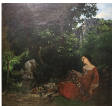
图5(法)古斯塔夫·库尔贝，《持花环的女子》，1856年，布面油画，125cm x 133cm，全山石艺术中心藏

库尔贝的现实主义实践本质上是一场针对艺术体制的视觉革命。1855年《现实主义宣言》宣称“只画眼见之物”，艺术中心陈列的库尔贝作品《持花环的女子》（图5）（1856）具有符号学意味：少女粗壮的手指与枯萎花环形成对抗性叙事，前者象征劳动的真实重量，后者解构古典美学的虚妄浪漫。这种“去理想化”策略，正如本雅明·布赫洛（Benjamin H.D. Buchloh）所言，通过将“被压抑的现实”（劳动人民）置于画面中心，实现了视觉领域的阶级政治颠覆。