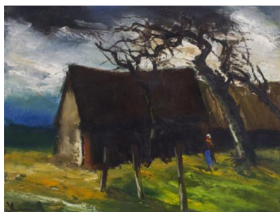
图9(法)弗拉曼克,《农舍》50.8cm×65.4cm,布面油画,全山石艺术中心藏