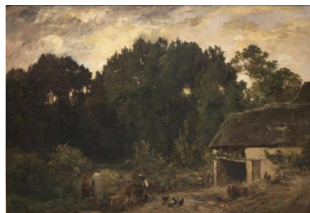
图3 (法) 查理·弗兰斯瓦·杜比尼，《制桶者》，1872年，布面油画，114.3cm x 167cm，全山石艺术中心藏

在视觉革命进程中，杜比尼的“水上画室”实践具有特殊的方法论价值。其晚年重要作品《制桶者》（图3）以黄昏时分的劳作场景，将农民日常升华为田园史诗。1857年启用的画船“小盒子”（Botin），通过移动观察构建动态视觉坐标系，这与宋代文人书画船的“搜妙创真”形成跨时空理念共振。值得注意的是，中国唐代张璪“外师造化，中得心源” ② 的命题，强调自然观察与心灵体悟的辩证统一，而巴比松画家则通过外光写生将“光色一笔触”作为独立表意媒介。两种传统在“自然作为认知起点”层面形成比较视域，却在技术路径上呈现根本差异：前者侧重“以形写神”的意象提炼，后者追求“光学真实”的物质性再现 [2] 。