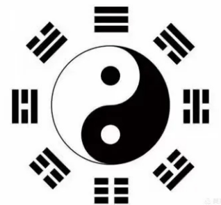
图 1 太极八卦图

关于太极图，倒有一些共识。太极图有很多种，诸如周敦颐太极图，先天太极图（原名“天地自然之图”，俗称“阴阳鱼太极图”），古太极八卦图（见图 1），来知德太极图以及清朝端木国瑚太极图，等等。大多研究者比较认同的观