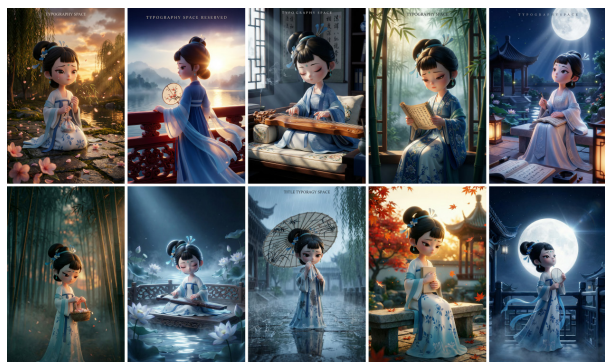
(图2：林黛玉IP场景化海报合集)