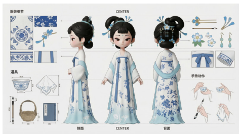
(图1：林黛玉IP人物设定图)

数字传播的核心价值不仅在于IP形象的广泛扩散，更在于推动年轻群体对林黛玉形象的文化认同重构，同时印证IP化转译的文化价值。在文化认同重构的基础上，本次林黛玉IP化转译实践进一步印证了其核心文化价值。IP化转译通过“前置研究、特质提取、适配推导、符号选定、设计落地、传播赋能”的完整路径，为传统文学人物对接当代语境提供了可复制的文化转译方法论，这一方法价值的核心在于精准匹配人物核心特质与当代审美需求。从实践意义来看，通过IP的设计与传播，传统文学元素成功融入年轻群体日常生活，激发了其对古典文学的主动探索热情，实现了从小众阅读到大众传播的活态传承目标，而文化认同重构的实现更从效果层面验证了该转译路径的有效性。