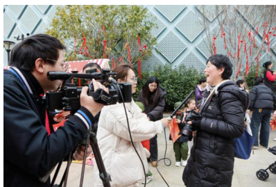
图1 传统采访及记录过程

传统的方式一般需要记者去和受访者协调好时间，然后亲自前往特定的场所开展面对面交流的工作，这个过程耗时间又耗费精力。要是突发新闻事件出现了，记者赶去现场所需要的时间窗口说不定会让其错过关键的瞬时动态，报道的时效性会降低很多。而且对于那些分布在不同地域甚至是不同国家的多元信源而言，想要组织一次集中的采访是特别险阻的，这就限制了报道的广度以及立体性。时空的障碍使得新闻生产不可完全跟上事件即时演变与全球互联的节奏，有时候不得不滞后于社交媒体上早已传开的信息碎片，影响了媒体的快速反应能力。