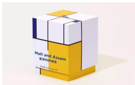
图1 ZEETEA 公司产品包装设计

不仅如此，ZEETEA 公司之所以采用风格派风格设计也与公司品牌理念相对应，ZEETEA 希望去除关于茶的联想和认知，因为在这些繁复背后只有一件对顾客来说最重要的事，就想喝点有味道的水，他们做的就是顾客想喝的最纯粹纯天然的茶，而风格派的理念就是对特征的简化，使之成为最简单的几何结构，最本质最纯粹。ZEETEA 公司将风格派很好的运用于旗下产品中，为产品增添设计感艺术感，瞬间博得了年轻群体的喜欢，产生了品牌效益。