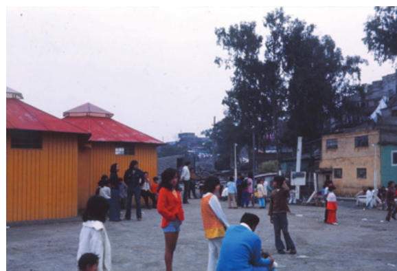
图2 嵌入社区的博物馆之家 呈现为橙色钢板外墙，红色屋顶的六边形建筑