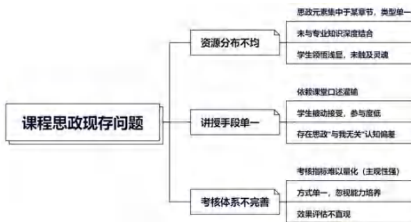
图 1 农业机器人课程思政教学现状

农业机器人课程的教学内容主要集中在机器人技术原理、农业机器人系统设计与应用等方面,教师在教学过程中往往专注于机器人的机械结构、控制系统、编程算法等专业知识讲解,未能充分认识到思政教育在塑造学生价值观、职业道德与社会责任感方面的关键作用,导致思政元素与专业教学内容“两张皮”现象严重,难以实现协同育人的目标 [9] 。农业机器人课程思政教学现状如图 1 所示。