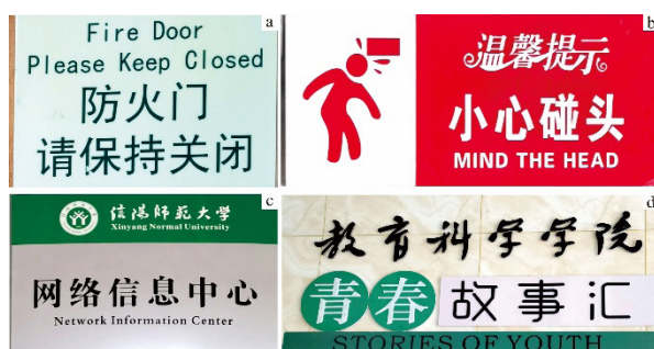
图2 信阳师范大学校园标识牌翻译错误及直译方式

第二,视觉模态碎片化,符号编码失序。校园语言景观中图标、色彩等视觉符号与翻译存在割裂。如“轻声慢步保持安静”、“无线网络已覆盖”“禁止吸烟”的温馨提示牌采用红色的符号设计(图3),在西方语境中,红色表示“危险”,而中文语境中红色兼具“警示”与“吉祥”双重含义。这种设计造成了严重的视觉冲击和一定程度上的感官不适,从而引起留学生对风险等级的跨文化认知偏差。