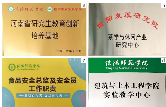
图1 信阳师范大学校园标识牌双语建设情况

第一,语言模态主导,文化适配不足。标识牌大多数仅采用单语(中文)呈现,导致非母语使用者在导航和信息获取上存在一定障碍(图1-a、图1-b)。双语标识集中于国际化课程、跨文化项目的相关教学区域,沿用“信阳师范学院”的翻译(图1-c、图1-d),而普通教学楼、宿舍、食堂等日常学习和生活场所的双语标识相对缺乏,有的还存在翻译错误,如“防火门”翻译为“Fire Door”(图2-a),“小心碰头”翻译为“MIND THE HEAD”(图2-b),这种分布的不均衡使得双语文化的可见度和普及度受到限制。双语课程教材、双语文本等翻译已基本实现“语言对等”,但文化内涵传递仍采用直译的方式。如“青春故事汇”直译为“STORIES OF YOUTH”(图2-c),“网络信息中心”直译为“Network Information Center”(图2-d)未通过补充图示说明其职能,导致留学生仅能获取字面信息,难以理解服务场所的文化内涵。