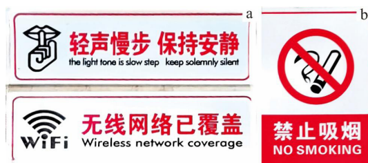
图3 信阳师范大学校园标识牌色彩符号设计现状

第二,视觉模态碎片化,符号编码失序。校园语言景观中图标、色彩等视觉符号与翻译存在割裂。如“轻声慢步保持安静”、“无线网络已覆盖”“禁止吸烟”的温馨提示牌采用红色的符号设计(图3),在西方语境中,红色表示“危险”,而中文语境中红色兼具“警示”与“吉祥”双重含义。这种设计造成了严重的视觉冲击和一定程度上的感官不适,从而引起留学生对风险等级的跨文化认知偏差。