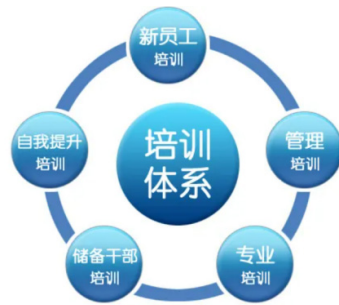
图 1 培训体系构成

主要针对新入职的青年职工开展思想政治教育工作，塑造他们的价值观。组织新员工参观企业的历史展厅卷烟生产线，邀请退休的老职工讲述艰苦历程。设置角色模拟活动，加强职工的一日体验，在各种真实的场景中，能够理解行业的合规性和社会责任。培训体系构成详见图 1。