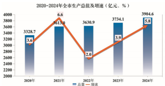
图1 廊坊市2024年国民经济和社会发展统计公报

廊坊市近年来以“两企三新”为重点,采取了一系列措施,把基层党建工作做得很扎实,成效明显。在组织建设上,廊坊市已经有一大批非公有制企业、社会团体成立了党组织,其覆盖范围也在不断提高。比如永清县“云裳小镇”,通过积极引导,建立起了健全的党支部,为全镇众多服装企业的发展提供了强有力的组织保证。