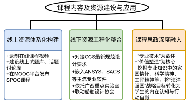
图 1. 课程内容及资源建设应用体系

下课后实践”的混合式教学模式改革，如图 2 所示，学生课前通过 SPOC 平台完成视频学习与单元测试，教师根据在线数据调整授课重点；课中采用“任务驱动+小组研讨”，如布置“自升式平台桩腿强度计算”任务，学生结合线上预习内容分组汇报，教师针对性答疑；课后通过实验室开放、参与船舶设计协会项目，将理论知识转化为实践能力。《海洋平台设计》课程“三维联动”混合式教学模式流程详见表 1。