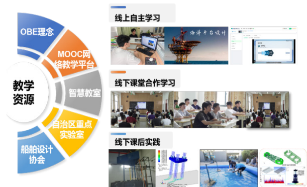
图 2. “三维联动”混合式教学模式改革示意图