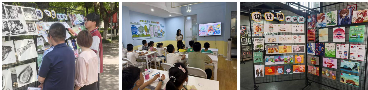
图2 校园文化节和社区服务

全面发展是“五育并举”的核心体现，中职教育既要培养技能型人才，还要注重学生德智体美劳全面发展，培育身心健康、素质全面的新时代青年。美育是关键纽带，能提升学生审美素养，能促进智育、德育、体育、劳育协调发展，助力学生思维提升、体质强化、劳动热情激发 [2] 。课程实施中需依托跨学科教学：数字媒体专业可联合语文教师开发“影视文案写作”模块，在学习镜头语言的同时提升文字表达能力；联合体育教师设计“运动场景拍摄”项目，在捕捉运动美感中理解体育精神。