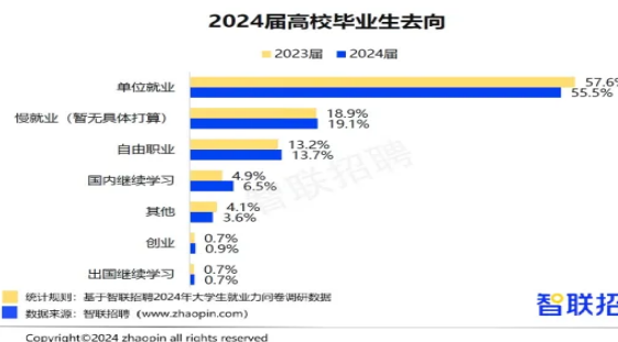
图1 2024届高校毕业生去向图

毕业生群体中,国企仍为首选就业去向,占比达47.7%,反映出他们在职业选择上更趋保守 [1] 。