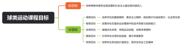
图 2-1：球类课程群的目标体系

目标层作为该体系的价值导向与终极归宿，秉持“五育融合”理念，构建层级化的目标体系。依托球类运动课程群教学，培养学生的多元能力。见图 2-1。